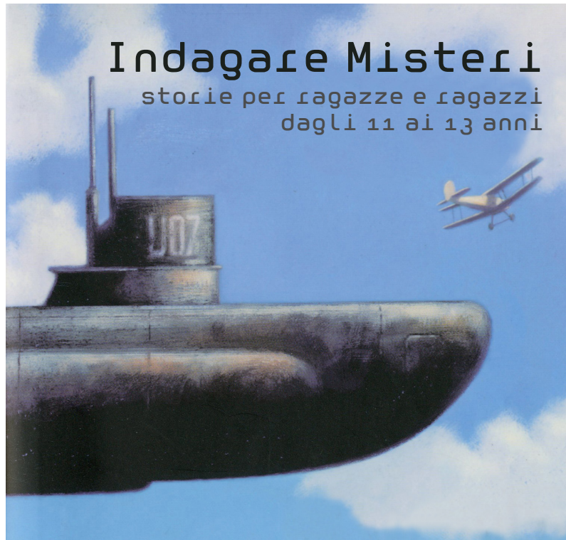
Immagine di copertina di Gianni De Conno tratta da Le volpi del deserto , Pierdomenico Baccalario, Mondadori , 2018. Si ringrazia la casa editrice per averne concesso l'uso.