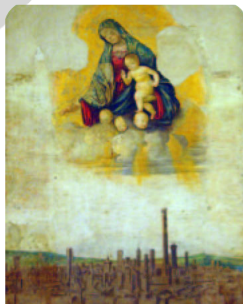
La Madonna del Terremoto , affresco di Francesco Francia, fu dipinta su una parete della Cappella degli Anziani come ex voto per il terremoto del 1505. Fu trasportata nel secolo scorso all'interno di Palazzo d'Accursio.

Tutti gli incontri sono gratuiti, per ragazzi dai 10 anni in poi. È gradita la prenotazione, tel. 051 2194411